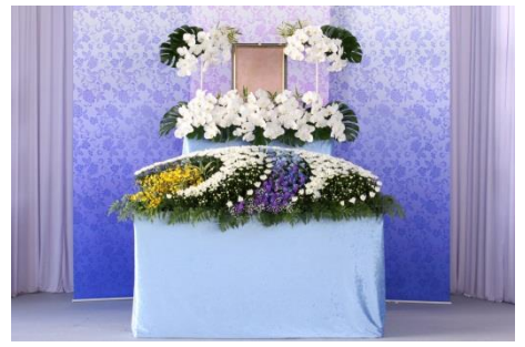
花祭壇 B タイプの場合