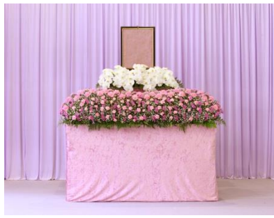
花祭壇 A タイプの場合